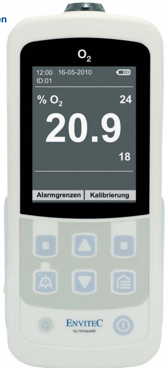
Gerät in Originalgröße