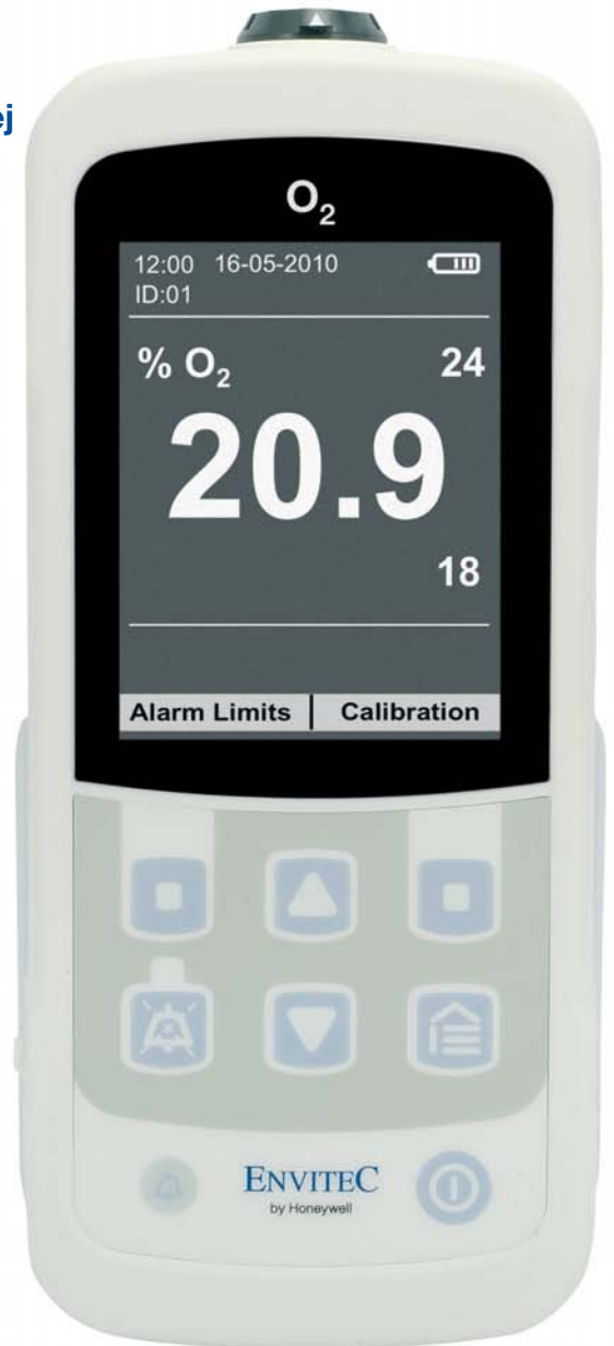
MySign® O (rozmiar rzeczywisty)

MySign® O jest kompaktowy, lekki i niezwykle prosty w użytku. Oferuje wysoką precyzyjność wymaganą w anestezji i neonatologii, a także bezkompromisową wytrzymałość podczas wymagających działań ratowniczych. MySign® O zapewnia natychmiastowy dostęp do parametrów \text{FiO}_2 twoich pacjentów, dając poczucie bezpieczeństwa nawet w krytycznych sytuacjach.